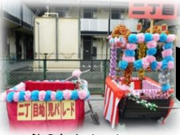
飾られたリヤカー