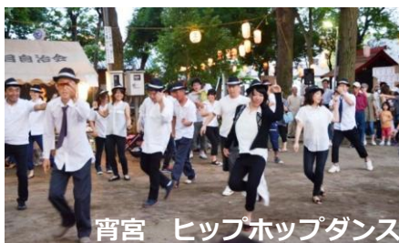
宵宮 ヒップホップダンス

祭りの前日夕方には、宵宮(よいみや)神輿蔵出しの神事、お囃子、神輿境内披露を行い、かき氷、綿あめ、ジュースなど飲み物など楽しい出店や、ヒップホップダンスなど多彩な催しで翌日の内谷祭りへと連なっていきます。