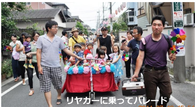
リヤカーに乗ってパレード