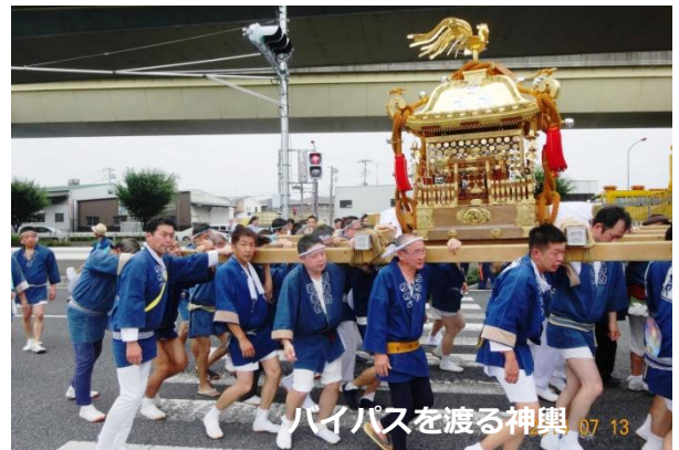
バイパスを渡る神輿 07.13

氷川神社境内の、八雲神社から10時に宮出した神輿は、内谷1丁目から7丁目までを渡御(神輿が進む)して各自治会に迎えられます。それぞれの自治会は“神酒所”を設け囃子、神輿、子供神輿をもてなします。