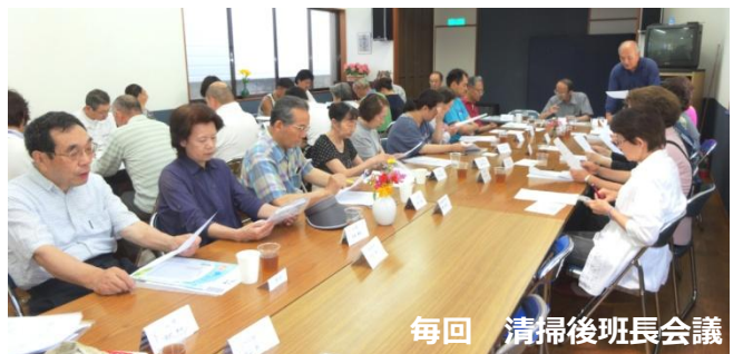
毎回 清掃後班長会議