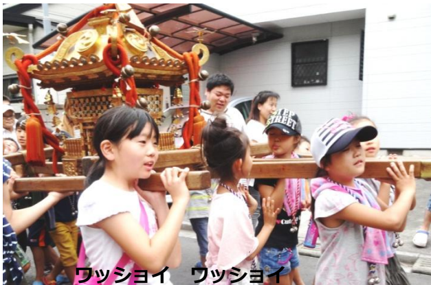
ワッショイ ワッショイ