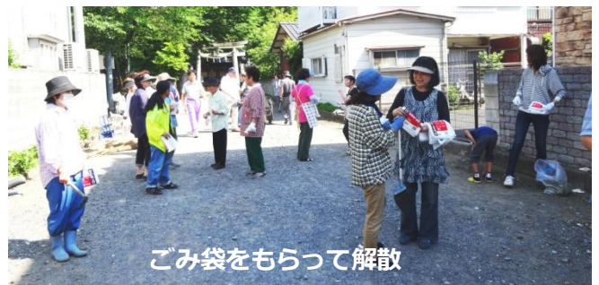
ごみ袋をもらって解散