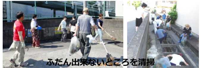
ふだん出来ないところを清掃

6月第1週の日曜は定例の清掃日。今年は市のごみゼロキャンペーンが1日(土)に設定したのでそれに合わせ、自治会員総出で清掃を行いました。自治会内に2本の水路があり、毎回水路に入っの雑草取り等していますが、今回は事前に市で行いました。市では水路に入らない範囲の清掃で結構といっていますので、今後も出来るだけ、年1度は水路清掃を依頼していきます。清掃後班長会議で祭りなど相談しました。