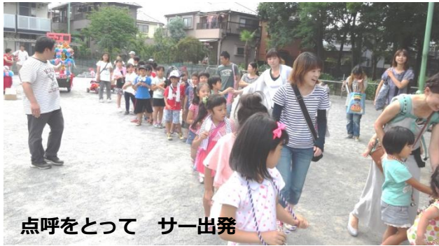
点呼をとって サー出発

子供神輿は、4丁目公園まで小学生のみなさんが迎えに行き、2丁目まで担いできます。